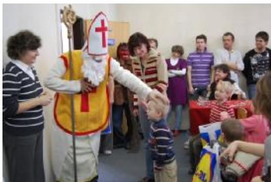
Mikulášská besídka v JUN dne 12.12.2009